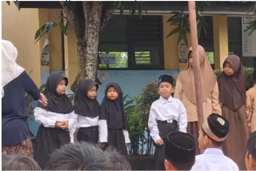
Gambar 2 anak yang melanggar aturan tata tertib

aturan setiap menjaga teman dengan bentuk kasih sayang jadi harus saling menjaga dan menghormati maupun fisik atas harta tetapi ada saja mungkin dari segi makan juga berbeda otomatis sudah ada rasa gaenak, aku gabisa gabung sama teman karna makannya berbeda dll” ucap salah satu guru di SDN Banjarsari 3.